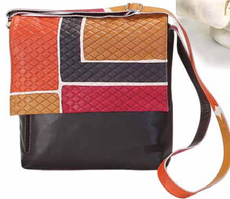
ART. 16014GR COL. K38