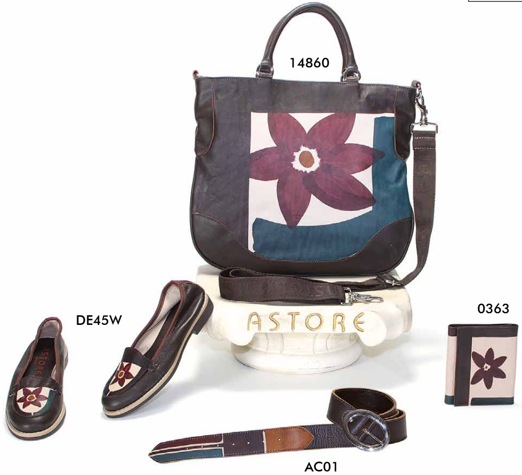
Natural leather handpainted