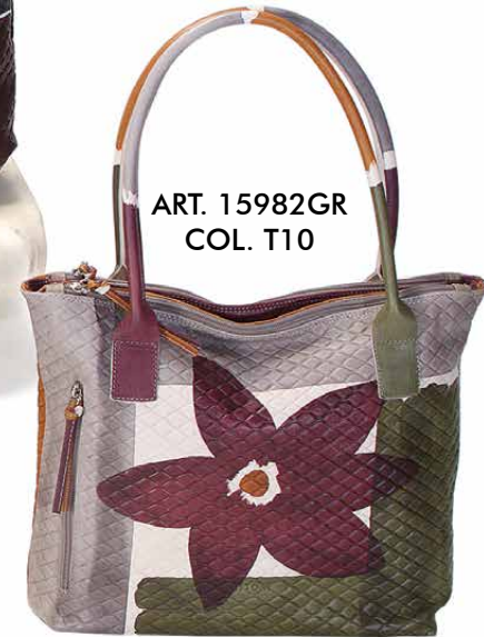
ART. 15982GR COL. T10