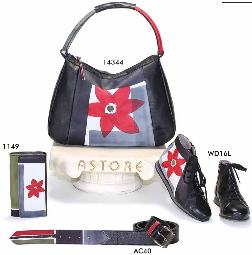
Natural leather handpainted