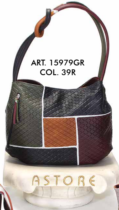
ART. 15979GR COL. 39R